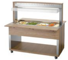
▶ Buffetwagen für warme Speisen