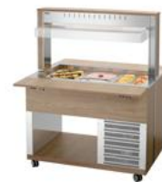
▶ Buffetwagen für kalte Speisen