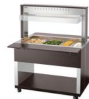
► Buffetwagen für warme Speisen