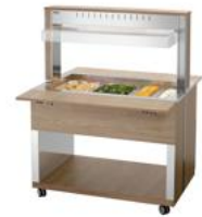
▶ Buffetwagen für warme Speisen