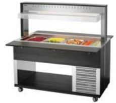
▶ Buffetwagen für kalte Speisen