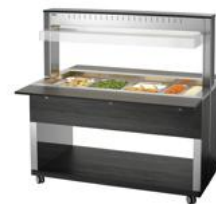
► Buffetwagen für warme Speisen