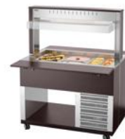
► Buffetwagen für kalte Speisen