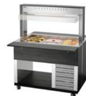
► Buffetwagen für kalte Speisen