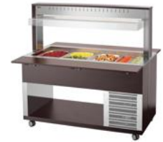
► Buffetwagen für kalte Speisen