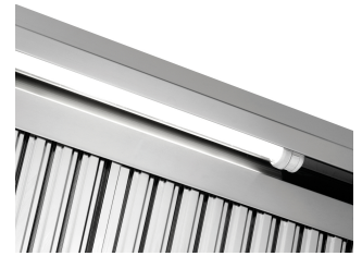
► Dunstabzugshaube mit 2 Filtern