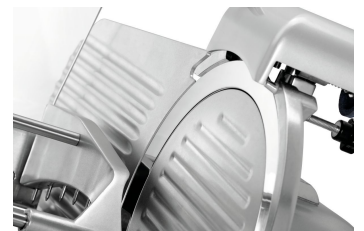
▶ Zweifacher Messerschutz