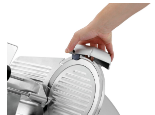
▶ Praktischer Messerschärfer

Die Ausstattung der optimierten Aufschnittmaschine mit einem 220er Messer überzeugt durch technische Features in mehrfacher Hinsicht. Der leistungsstarke Schrägschneider verfügt über einen Resthalter, einen Messerschärfer, eine Aufschnittführung und um die Sicherheit zu gewährleisten einen zweifachen Messerschutz sowie einen Magnetschalter.