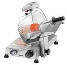
▶ Ausgelegt für Wurst