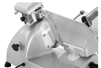
▶ Saubere Aufschnittführung