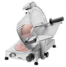
▶ Ausgelegt für Wurst