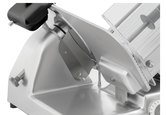
▶ Saubere Aufschnittführung