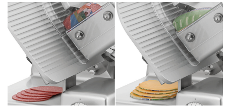
▶ Ausgelegt für Wurst und Käse