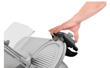
▶ Praktischer Messerschärfer