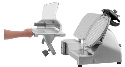
▶ Einfache Reinigung